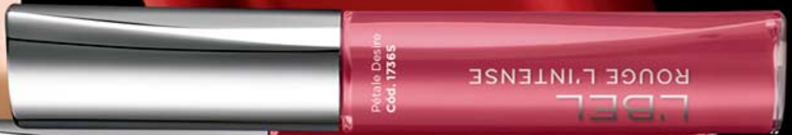
Pétale Désire Cód. 17365