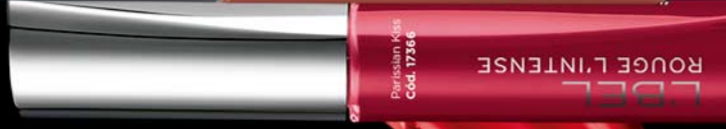
Parissian Kiss Cód. 17366