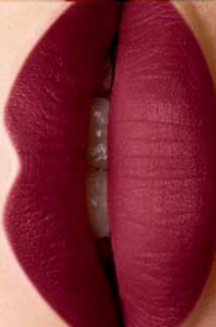
Intense Forever Cód. 01056