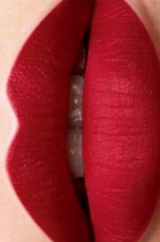
Passion Forever Cód. 01017