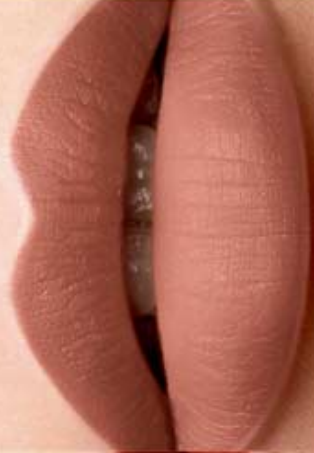
Nude Forever Cód. 01341