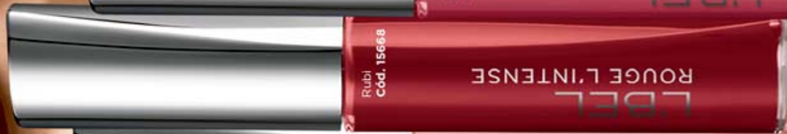
Rubi Cód. 15668