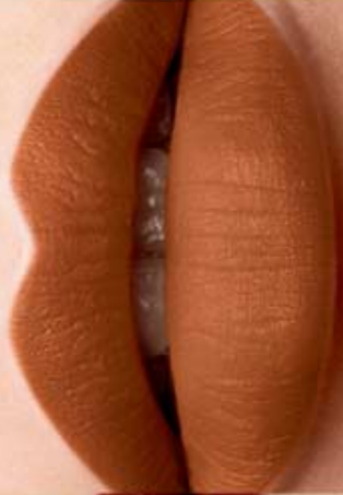
Brun Forever Cód. 01501