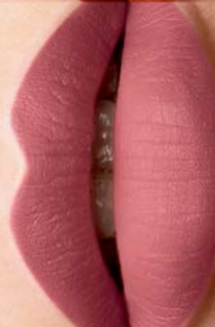
Exquisite Forever Cód. 01234