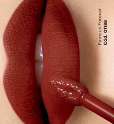
Famous Forever Cód. 01188