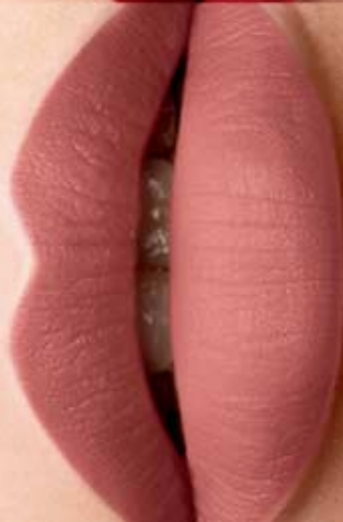
Adore Forever Cód. 01429