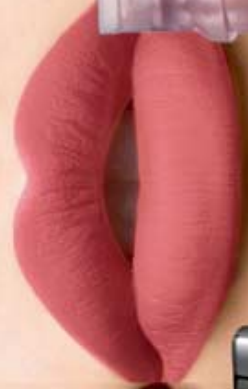
Rosé D'esprit Cód. 15666