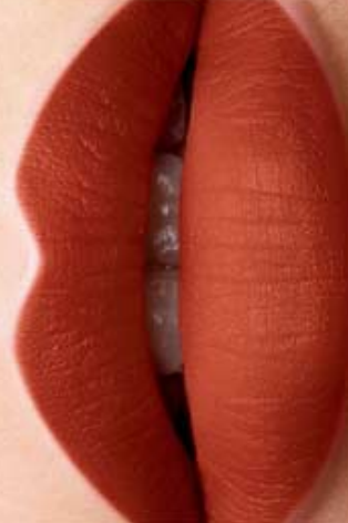
Paris Forever Cód. 01024