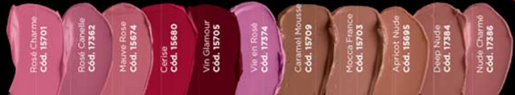
Rosé Charme Cód. 15701