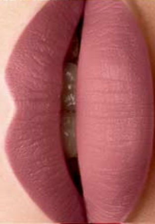
Rosé Forever Cód. 01211