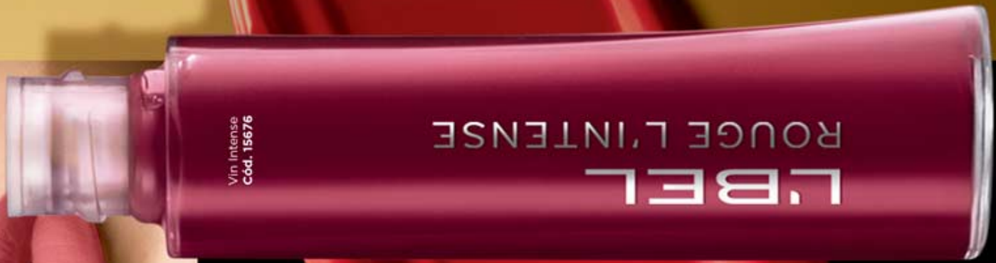
Vin Intense Cód. 15676