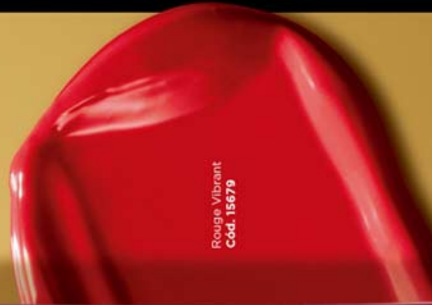
Rouge Vibrant Cód. 15679