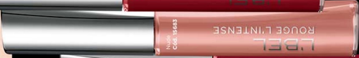
Nuide Cód. 15683